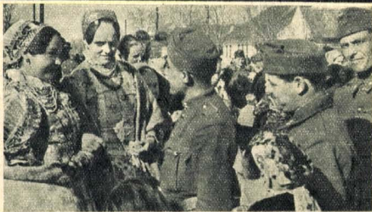
Az első beszélgetés a falu szépei és a honvédek között a Bácskában