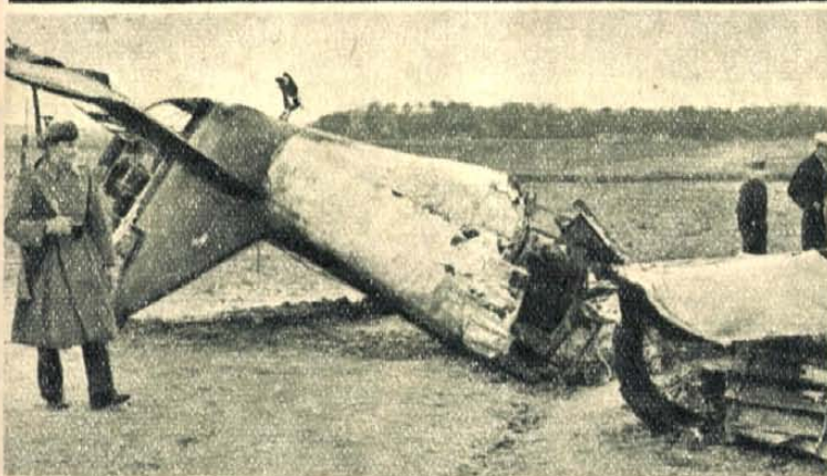
A Pécs mellett lelőtt Bristol-Blenheim típusú szerb repülőgép roncsai