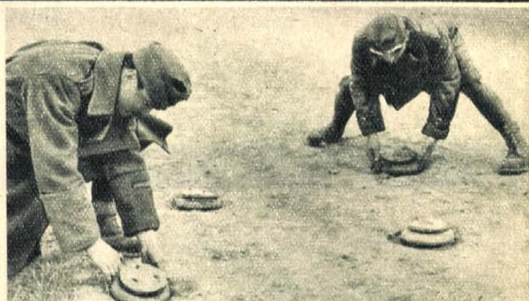
Utászkatonáink felszedik az országútba ágyazott szerb tányéraknákat