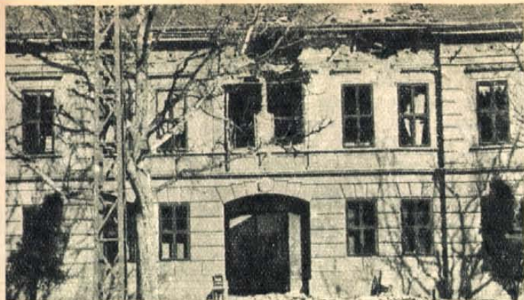
Összelőtt újvidéki ház, amelynek padlásáról csetnikék lövöldöztek