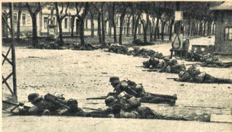
Szuronyt szegezve, hasoncsúszva nyomulnak be honvédeink Zomborba