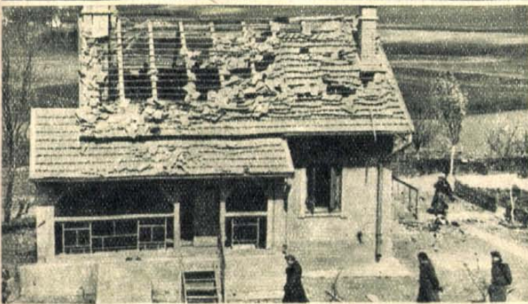
Az orvul lövöldöző csetnikék főszéke volt ez az összelőtt lakóház