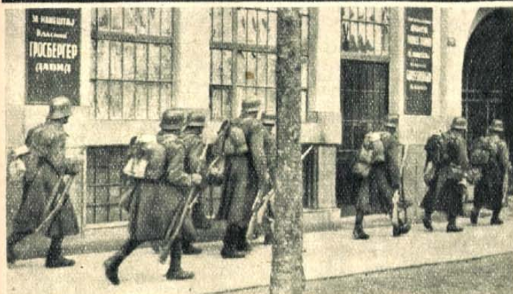
Magyar járőr Zombor egyik uccáján orvtámadó csetnikék után kutat