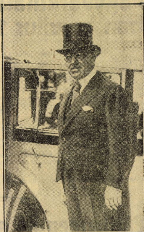
Avonol, a Népszövetség fűtlikára Londonban, ahol az olasz-abesszin kérdés ügyében folytat nagyfontosságú tárgyalásokat