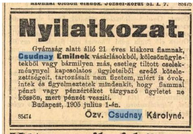
Budapesti Hírlap 1905. július 4-i száma