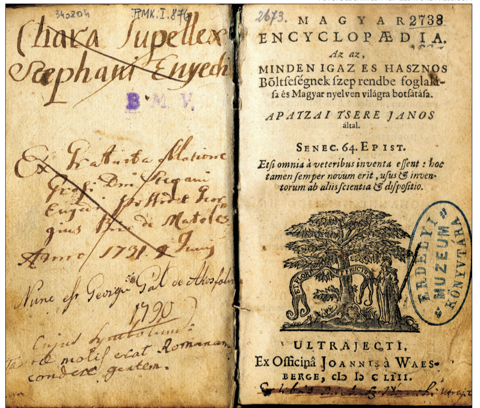
Apáczai Csere János (Apatzai Tsere Janos) Magyar Encyclopaedia című műve 1653-ból