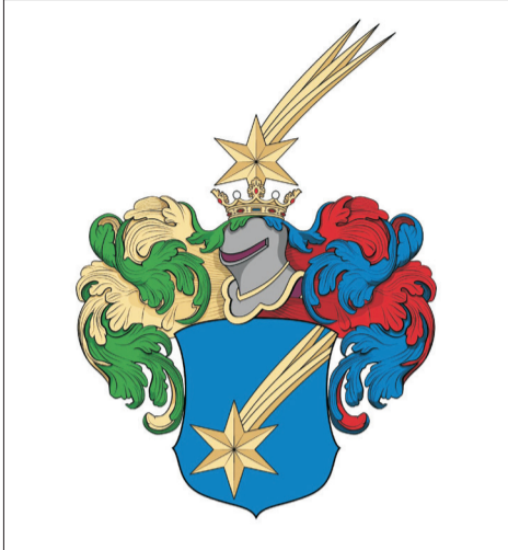
A szerző címerrekonstrukciója

2016-ban a Háromszék hasábjain írtam a címerek születéséről. 1128. június 10-ét a heraldikusok nagy része a címer születésnapjának tekintik. Ugyanis ezen a napon I. Henrik angol király lovaggá ütötte a francia V. Gottfridet, Anjou grófját (közismerten Geoffrey Plantagenet), és közben címeres pajzsocskával is kitüntette.